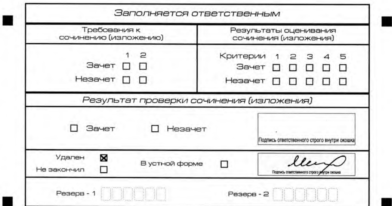
Рис. 13. Заполнение полей нижней части бланка регистрации (удаление с экзамена)

В случае если участник итогового сочинения (изложения) нарушил установленные требования, изложенные в пункте 28 Порядка проведения государственной итоговой аттестации по образовательным программам среднего общего образования (приказ Минпросвещения России и Рособрнанадзора от 4 апреля 2023 г. № 232/551), он удаляется с итогового сочинения (изложения). Член комиссии по проведению итогового сочинения (изложения) составляет «Акт об удалении участника итогового сочинения (изложения)» (форма ИС-09), вносит соответствующую отметку в форму ИС-05 «Ведомость проведения итогового сочинения (изложения) в учебном кабинете ОО (месте проведения)» (участник итогового сочинения (изложения) должен поставить свою подпись в указанной форме). В бланке регистрации указанного участника итогового сочинения (изложения) необходимо внести отметку «X» в поле «Удален». Внесение отметки в поле «Удален» подтверждается подписью члена комиссии по проведению итогового сочинения (изложения) (см. рис. 13).